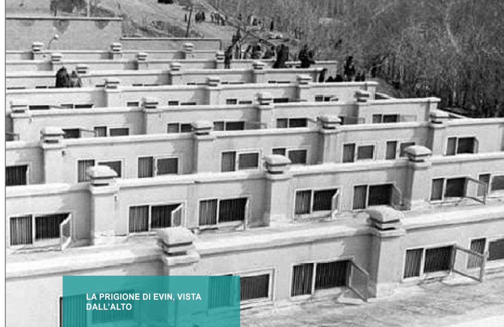
LA PRIGIONE DI EVIN, VISTA DALL'ALTO