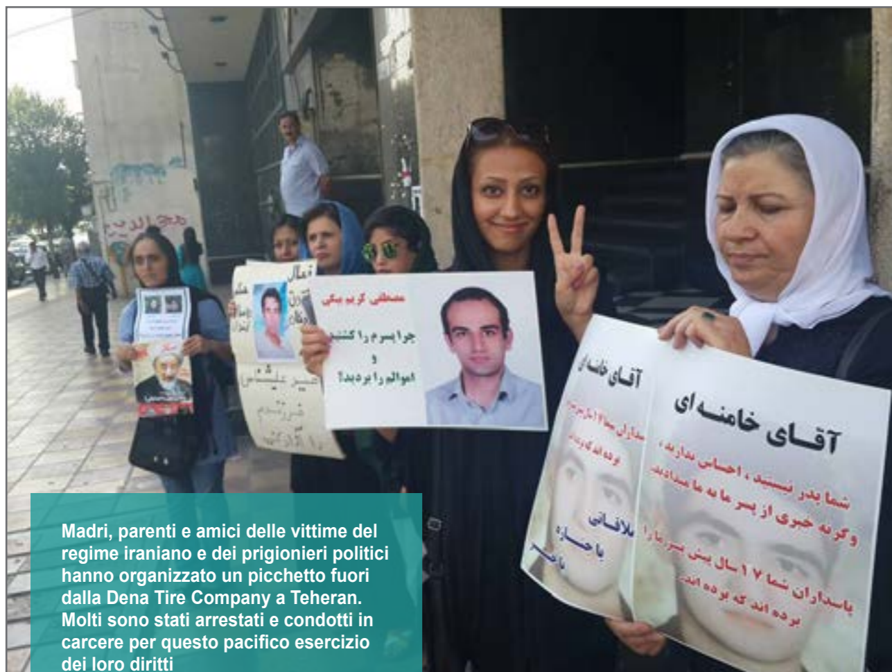
Madri, parenti e amici delle vittime del regime iraniano e dei prigionieri politici hanno organizzato un picchetto fuori dalla Dena Tire Company a Teheran. Molti sono stati arrestati e condotti in carcere per questo pacifico esercizio dei loro diritti