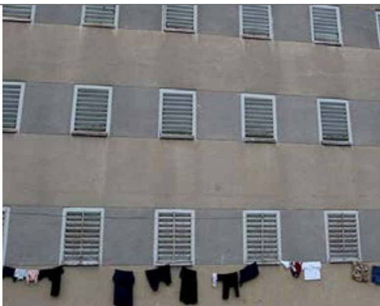
Tutte le finestre ad Evin sono sigillate, e l'assenza di luce solare causa alle detenute numerose malattie.

Prima che la prigioniera riceva un congedo medico, solitamente dopo 9-12 mesi, la sua malattia è progredita. Una volta in ospedale, il suo trattamento è solitamente interrotto a metà. Ogni ingresso ed uscita dalla prigione richiede perquisizioni umilianti. Una prigioniera deve essere ammanettata mentre va al dispensario. Il braccio delle donne è costantemente monitorato dalle telecamere. Quando i guardiani della prigione s'imbattono in una protesta o in qualche forma di resistenza da parte delle prigioniere, esse vengono minacciate di trasferimento alla famigerata prigione di Qarchak.