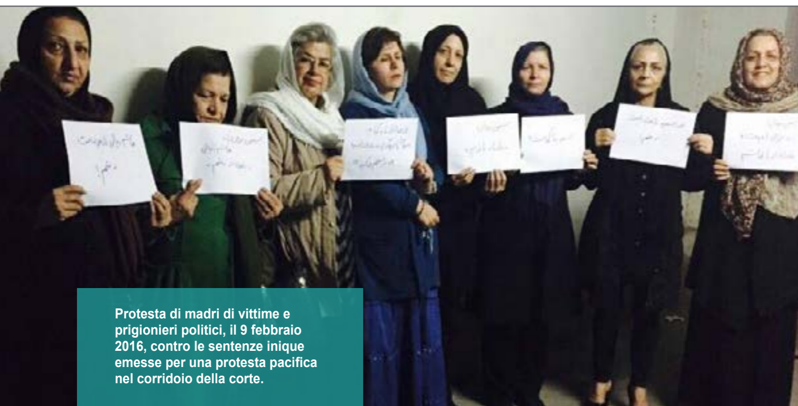
Protesta di madri di vittime e prigionieri politici, il 9 febbraio 2016, contro le sentenze inique emesse per una protesta pacifica nel corridoio della corte.