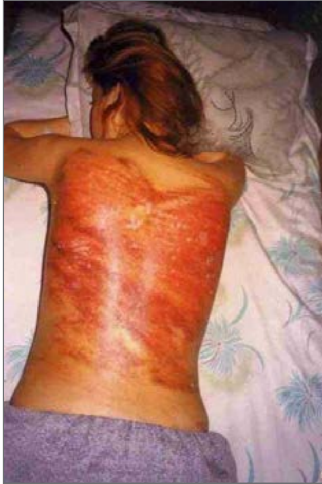
Le donne che non indossano correttamente il velo sono minacciate di fustigazione in pubblico.

La guida della preghiera del venerdì di Ahwaz ha annunciato il 16 giugno 2016: “Delegazioni di ispezione, incluso un giudice, hanno iniziato il loro lavoro nelle strade e piazze più grandi per frustare le donne che dovessero non rispettare gli avvertimenti verbali dati per le strade”.