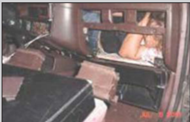
UNE VICTIME EST CACHÉE DANS LE TABLEAU DE BORD D'UNE VOITURE

Certaines de ces femmes n'arrivent jamais à destination en raison des conditions de transfert difficiles et leurs corps sont jetés à la mer.