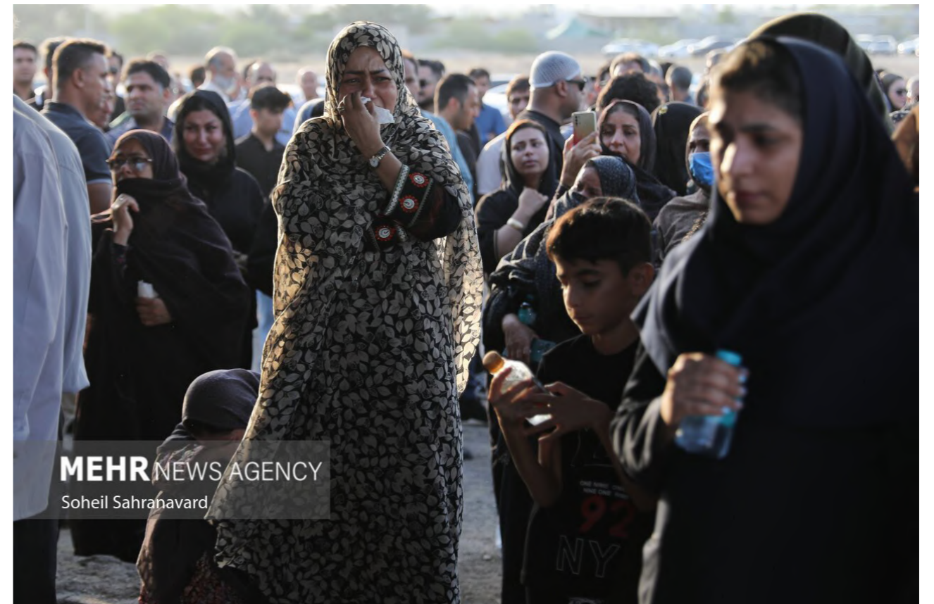
MEHR NEWS AGENCY Soheil Sahrahavard

مادر سالخورده، همسر جوان و خواهری معلول که به‌رغم سی سال سن، آن‌قدر نحیف است که کودک به نظر می‌رسد. خانه‌شان در حال فروپاشی است و فقر از دیوارهای آن می‌بارد. حیات‌الله نان‌آور این خانواده بود و اکنون دیگر نیست. این خانواده‌ها عمدتاً بی‌سوادند. آنچه اکنون روشن است، حجم گسترده‌ای از رنج، فقر، بی‌پناهی، بی‌هویتی و ناتوانی در پیگیری حقوق است. هیچ‌کس پاسخ نمی‌دهد که چرا این تعداد کارگر فاقد هویت و نظارت در یکی از مهم‌ترین بنادر کشور مشغول به کار بوده‌اند؟ چرا استانداردهای ایمنی صنعتی تا این اندازه سست و بی‌پشتوانه بوده‌اند؟ چرا زیرساخت‌های مقابله با بحران این‌گونه ناکارآمد عمل کرده‌اند؟ و اکنون، چه کسی قرار است پاسخ‌گوی این فاجعه انسانی باشد؟ (رکنا - ۲۱ اردیبهشت ۱۴۰۴)